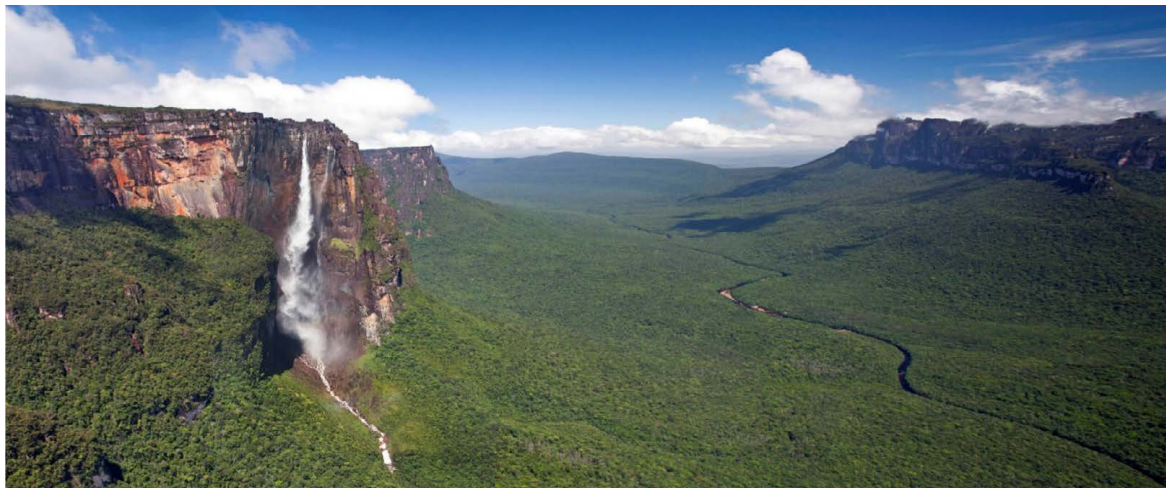
Figura 1. Panorámica de un sector del Parque Nacional Canaima, con el Tepuy Auyan y el Salto Ángel a la izquierda, sitio donde Miller efectuó un trabajo pionero, al elaborar uno de los primeros planes de manejo para un parque nacional en América Latina.

Figure 1. Panoramic of a sector of the Canaima National Park, with the Tepuy Auyan and Angel Falls on the left, the site where Miller carried out pioneering work, developing one of the first management plans for a national park in Latin America.