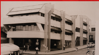
Fachada principal Edificio Administrativo de la Rectoría, Campus Omar Dengo Heredia

Se inaugura un 14 de marzo de 1973, contando con una matrícula inicial cercana a los 2500 estudiantes y 200 docentes.