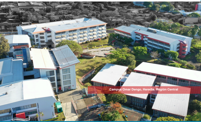
Campus Omar Dengo, Heredia. Región Central