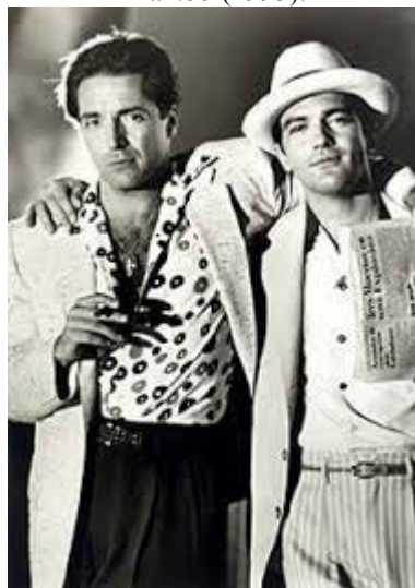
Figura 6. Fotograma del filme estadounidense Los reyes del Mambo (1995).