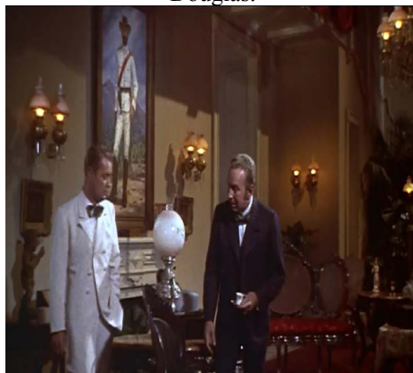
Figura 4. Fotograma del filme estadounidense Santiago de Gordon Douglas.