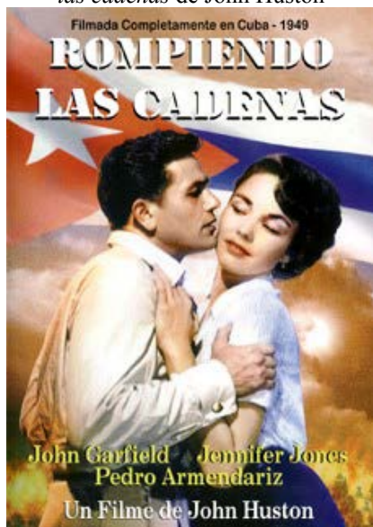
Figura 3. Poster del filme Rompiendo las cadenas de John Huston

La secuencia final del filme donde vemos a Tony Fenner disparar su ametralladora al ser sorprendido por la policía desde ese interior del túnel que construían constituye un homenaje a un clásico del cine negro como Scarface (1933), de Howard Hawks, al apelar a elementos de la estética del cine negro como una fotografía sustentada en el claroscuro que refuerza el sentido dramático y trágico de la historia (Véase Fig. 3).