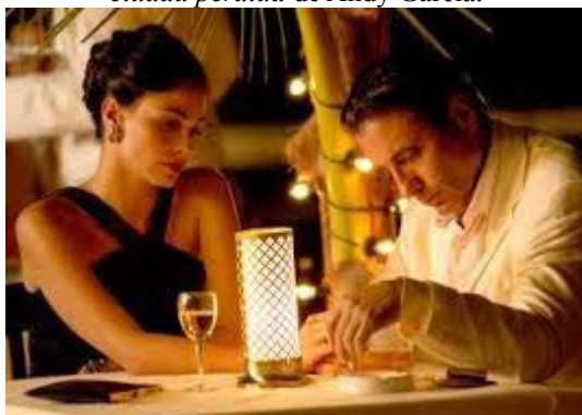
Figura 7. Fotograma del filme estadounidense La ciudad perdida de Andy García.