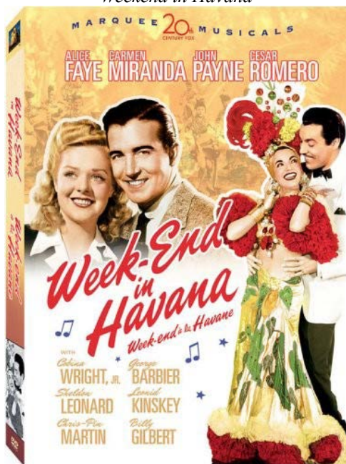
Figura 2. Poster del DVD original del filme Weekend in Havana