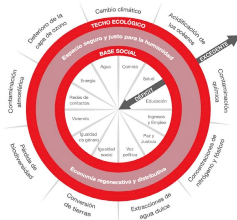
Figura 2. Dona de Raworth (2018b, p. 54) adaptada por Kayser (2020).

la economía de la dona. La dona “es una brújula radicalmente nueva para guiar a la humanidad en este siglo. Y apunta a un futuro que puede satisfacer las necesidades de cada persona al tiempo que salvaguarda el medio natural del que todos 2 dependemos” (Raworth, 2018b, p. 53). La Figura 2 especifica cuáles son los elementos que construyen esa dona.