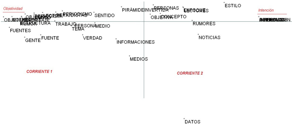
Figura 3. Mapa situacional estructural de las asociaciones léxicas de las cuarenta palabras–tema de la objetividad

Pero, además de desmontar terminológicamente los conceptos que asientan la noción de la objetividad entre los informadores, el otro gran interés de este análisis es determinar las asociaciones que se establecen entre esos mismos términos. En el siguiente mapa perceptual notamos que el grupo de entrevistados tiende a asociar esos cuarenta términos en dos corrientes dispersas según el posicionamiento general de las asociaciones. El grado de cercanía entre las etiquetas terminológicas significa, asimismo, el grado de cercanía en que esas palabras suelen aparecer en las respuestas evaluadas 3 :