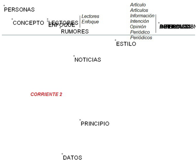
Figura 1. La corriente 2: microtendencias sobre objetividad.

El siguiente mapa perceptual aumenta la visualización de las 16 palabras–tema ( personas, concepto, lectores, enfoque, rumores, noticias, principio, datos, estilo, artículo, artículos, información, intención, opinión, periódico, periódicos ), que integran la casuística de la corriente 2 5 .