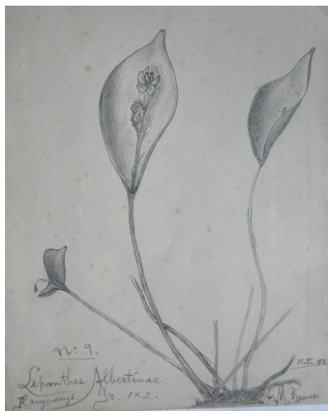
Figura 2. Dibujo a lápiz de la orquídea Lepanthes Albertinae , que data de 1921. Figure 2. Pencil drawing of the Lepanthes Albertinae orchid, dating from 1921.

Cabe destacar que, en la labor de rescate de su obra escrita, Salazar (2009) pudo recopilar cuatro de sus textos, correspondientes a los informes con la Comisión Austriaca en Guanacaste y con la Comisión Científica Austriaca en Golfo Dulce, así como la lista de Orquídeas de Costa Rica y Notas orquídeológicas, que es una especie de bitácora en la que anotaba, con fecha, la floración y los detalles de su colección privada de orquídeas, algunas de las cuales tienen dibujos hechos a lápiz (Figura 2).