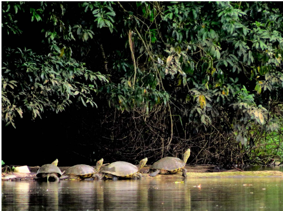
Figura 3. Tortugas de río ( Trachemys sp.) descansando sobre troncos flotantes, en la zona baja del río Parismina.

Figure 3. River turtles ( Trachemys sp.) resting on floating logs, in the lower area of the Parismina river.