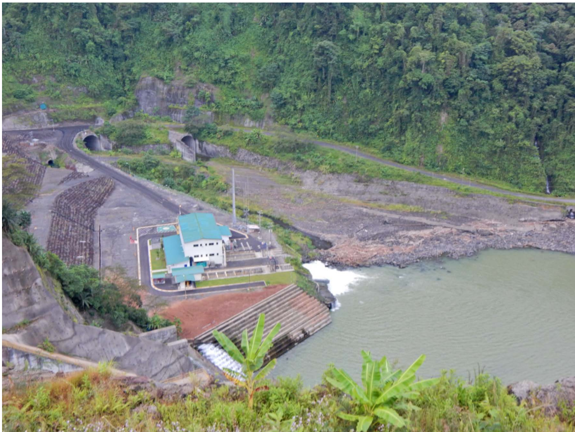
Figura 2. Proyecto Hidroeléctrico Reventazón. Central ecológica al pie de presa, vierte el caudal ambiental para el tramo crítico.

Figure 2. Reventazón Hydroelectric Project. Ecological power station at the foot of the dam, pouring the environmental flow for the critical section.