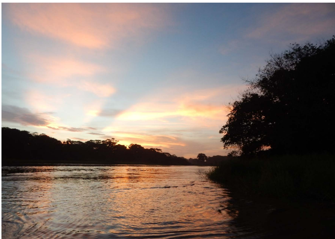
Figura 1. El río Reventazón en la zona baja de su recorrido.

En realidad, por caudaloso, el río Reventazón es el principal componente de la red fluvial que drena la vertiente del Caribe de Costa Rica ( Figura 1 ), por lo que no pasó inadvertido para las poblaciones primigenias del territorio nacional. En lo que no hay consenso es en su nombre. Por ejemplo, según el historiador González (1906) , el Reventazón es el mismo río Suerre, denominación con la que se conocía a toda la región irrigada por el Reventazón y el Parismina, aunque el lingüista y etnógrafo Gagini (1919) considera que el nombre Suerre corresponde solamente al río Pacuare, que desemboca no tan lejos del Reventazón; asimismo, él explica que su etimología proviene de las lenguas de Talamanca y está formado por las palabras sue (tortuga) e ire (río) por lo que el nombre compuesto sería río de las Tortugas. Es decir, de alguna manera, hay una asociación entre las tortugas y las aguas de estos ríos caribeños.