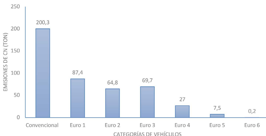
Figura 2. Emisiones de carbono negro (CN) por estándar de vehículo. Figure 2. Black carbon (CN) emissions by vehicle standard.

La Figura 2 presenta las emisiones por tipo de estándar de vehículo (se incluyen únicamente automotores diésel). Los resultados revelan que un 89.5 % de las emisiones totales de carbono negro de la flotilla vehicular costarricense fue generado por vehículos anteriores al 2005 (previo a Euro 4), los cuales apenas representan el 10.4 % de la flotilla nacional. El 42.4 % de estas fue generado por vehículos con estándar convencional (previo a 1994), cuyo peso porcentual en la flota vehicular es de apenas un 3.4 %. Al respecto, Kholod et al. (2016) mostraron resultados similares en sus investigaciones: vehículos pre-euro emitieron el 55 % del total de las emisiones de carbono negro. De igual forma, Cruz-Núñez (2014) y Lau et al. (2015) señalan el impacto de la antigüedad de la flotilla vehicular como un factor determinante en la generación de carbono negro y comprueban la incidencia de las normativas de control de emisiones (Euro) y las tecnologías asociadas a los automotores para el cumplimiento de la reducción directa de las emisiones.