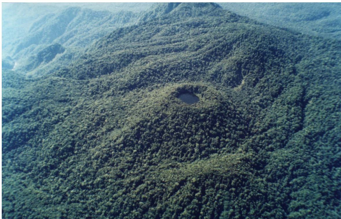
Figura 2. Vegetación en la cima y las estribaciones del volcán Barva. Figure 2. Vegetation on the top and foothills of the Barva volcano.

Hasta hoy, a 134 años de distancia, aquella propuesta de Pittier, acogida con tanta presteza por las dirigencias políticas —siempre atentas a sus sopesados y constructivos consejos—, ha permitido que esa extensa área montañosa, además de embellecer la de por sí hermosa cima del volcán Barva ( Figura 2 ), siga suministrando el agua que demanda una inmensa porción del Valle Central. Este hecho, por sí solo, inmortaliza a Pittier en nuestra sociedad.