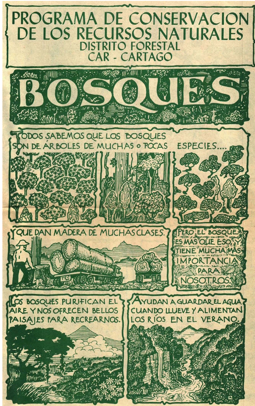
Figura 2. Primera página de una publicación divulgativa de Rafael Lucas acerca de los bosques y su conservación. Figure 2. First page of an informative publication by Rafael Lucas about forests and their conservation.