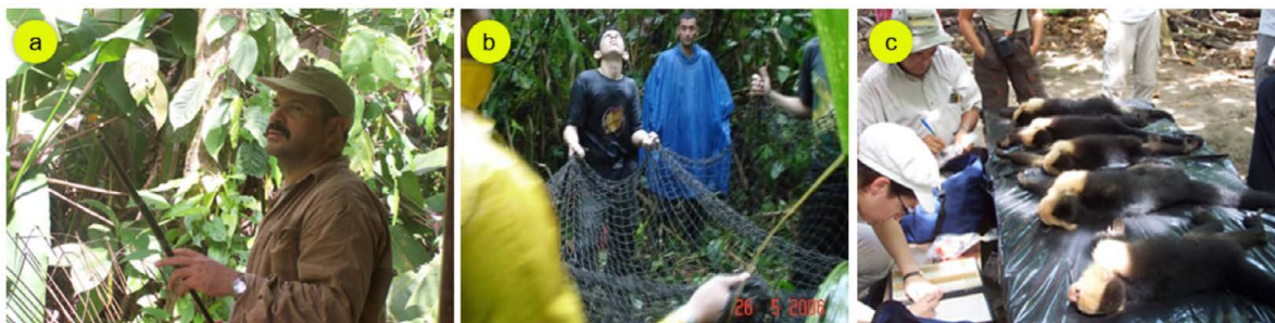
Figura 2. Técnica de captura con cerbatana (a y b), y registro de las medidas morfométricas (c).

Una condición esencial para poder diseñar los pasos aéreos o puentes fue contar con las medidas morfométricas de las cuatro especies monos. Para ello, se capturaron 327 monos (147 congos, 75 cara blancas, 40 titís y 65 colorados), en 125 puntos de todo el país y según distribución geográfica de cada especie. Todos se anestesiaron y se utilizaron dos técnicas para capturarlos. Para las dos especies de peso inferior a 3 kg (carablanca y tití) se empleó una cerbatana rústica con dardos tranquilizantes ( Figura 2 ), mientras que para las otras dos se eligieron dardos anestésicos desechables (de 1 ml y una aguja de 3/8") de Zoletil 50 (Hidrocloruro de Tiletamina base e Hidrocloruro Zolazepan base), disparados con un rifle marca Sheridan (modelo 176, Pneu Dart, Inc., Pensilvania); los dardos fueron impulsados por medio de cápsulas de CO 2 comprimido. La dosis del anestésico se ajustó en función del peso estimado de la especie a capturar. Una vez que el dardo penetró en el muslo, el tranquilizante hizo efecto entre 2 y 5 minutos. Con una red de nailon sujeta por cuatro personas, se esperó la caída de cada espécimen para evitar que se golpeará.