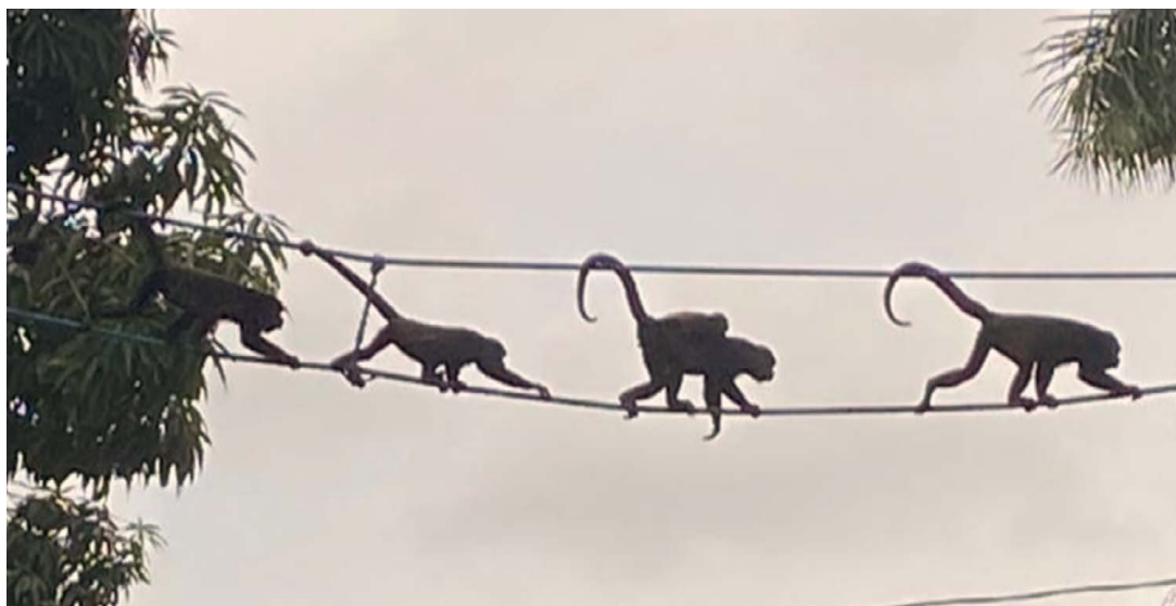
Figura 3. Ejemplo de un puente diseñado con base en medidas morfométricas, confeccionado por la organización Somos Congos. Cóbano, Puntarenas, Costa Rica.

La distancia de los soportes verticales entre sí se ubica cada 2.5 m en puentes superiores a 20 m, y de 3 m en inferiores a 20 m. Cada soporte vertical debe medir 65 cm entre las cuerdas principal y de guía, y no debe ser menor a 60 cm ni mayor a 70 cm; la cuerda utilizada debe tener 12 mm de grosor. Los anclajes o amarres deben ser colocados preferiblemente en árboles maduros, que les brinde la seguridad y la movilidad de ingreso y salida del puente ( Figura 3 ).