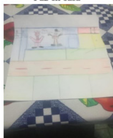
Imagen 18 "Paz en casa"

Dibujo de Diego Porras, persona con discapacidad cognitiva. El dibujo representa su casa, él junto a su madre.