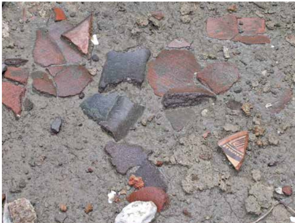
Foto 9. Restos de vasijas encontradas en Copal

con una vocación turística media, que permitirá hacer caminatas dirigidas y por encontrarse en el camino principal del sector de Pochote y estar disponible todo el año; sin embargo, hoy día se tiene prohibido el acceso.