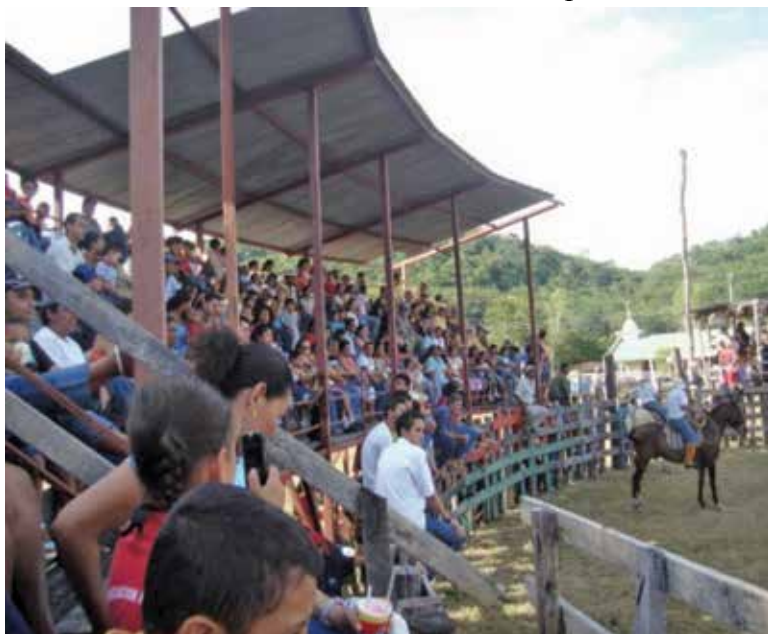
Foto 5. Redondel de toros, Copal

Tiene una vocación turística alta ya que, por sí misma, posee varias ventajas que hacen que sea un recurso con gran potencial para ser ofertado. El acceso a la comunidad de Copal no requiere de ningún esfuerzo físico, se puede llegar en vehículo particular o autobús; lo mismo sucede con los recorridos por la comunidad, debido a que la topografía sin pendiente y las cortas distancias hacen que no se deba incurrir en esfuerzos físicos demandantes. La comunidad de Copal es muy segura, cuenta con las facilidades requeridas para el disfrute de los visitantes y permite realizar diversas actividades como caminatas por la comunidad y por senderos, observación de flora y fauna, interacción con los habitantes y contacto con el modo de vida de la comunidad, entre otros.