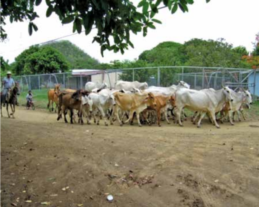
Foto 6. Actividad ganadera, Copal