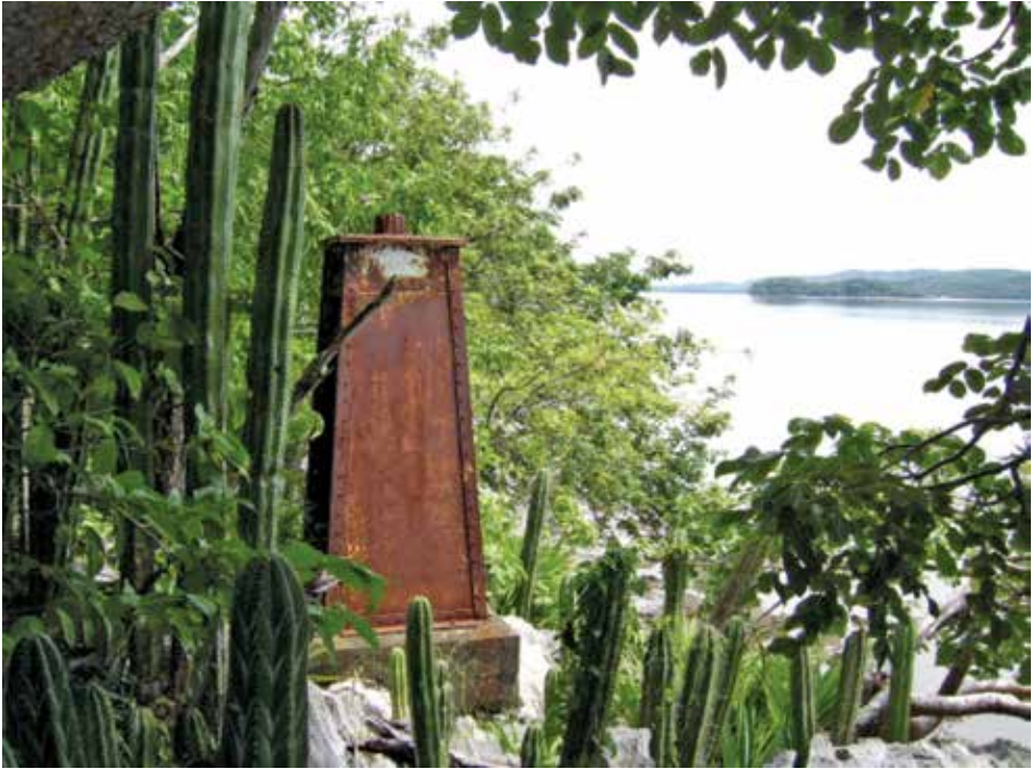
Foto 8. Restos Históricos Puerto Carazo, Cerro las Pozas de Copal