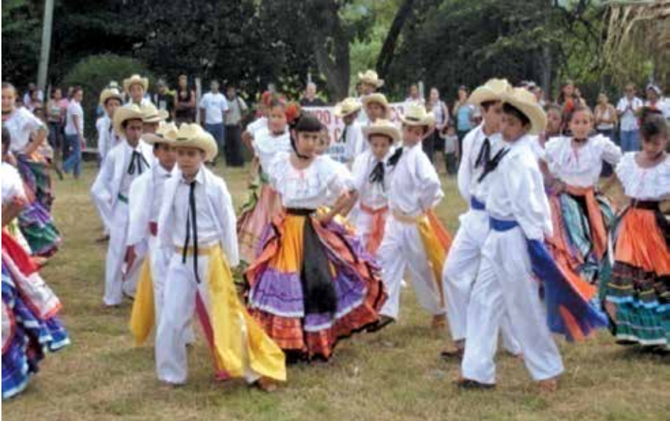
Foto 14. Actividades culturales, Copal

Es uno de los atractivos turísticos con mejor valoración; esto se debe, en parte, a que la feria es el principal producto turístico ofrecido por la comunidad de Copal. Presenta una vocación turística alta, a pesar de que sólo puede realizarse en período seco; sin embargo, la seguridad tiene una incidencia media, debido a que existen construcciones para desarrollar las diferentes actividades que son compartidas por diferentes organizaciones de la comunidad, el atractivo cuenta con algunas de las facilidades requeridas, pero el no contar con infraestructura propia, limita la realización de algunas actividades. No requiere de ningún esfuerzo físico por parte de los turistas, debido a que se realiza en el centro de la comunidad y no hay necesidad de desplazamiento; el acceso, debido a la topografía, y la ubicación del recurso no implican ninguna exigencia física y permiten que se realicen diferentes actividades en la infraestructura comunal.