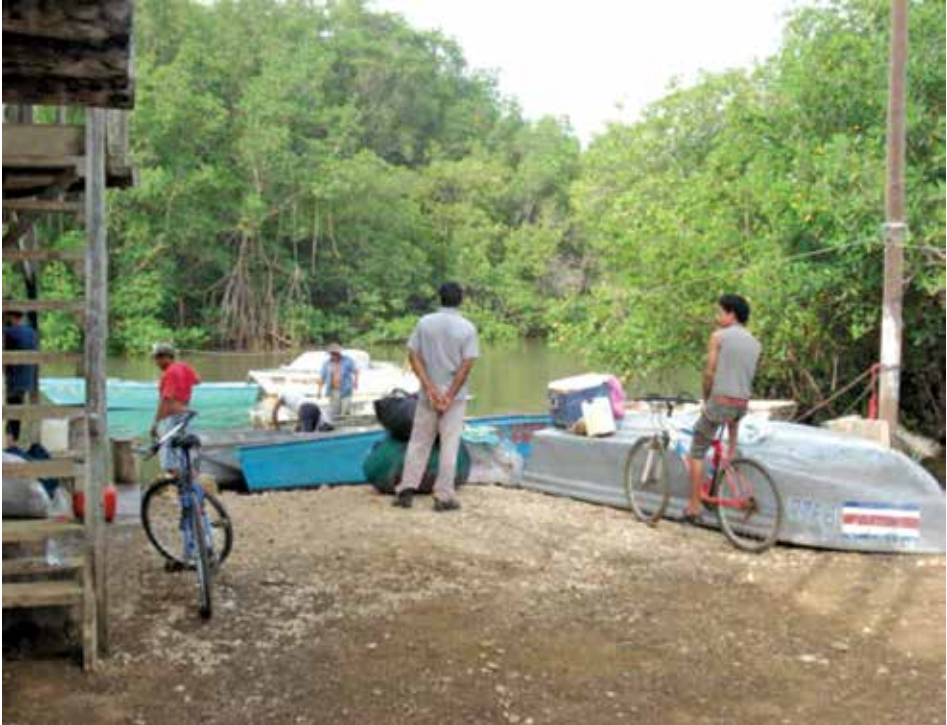
Foto 12. Grupo de pescadores en Puerto Pochote