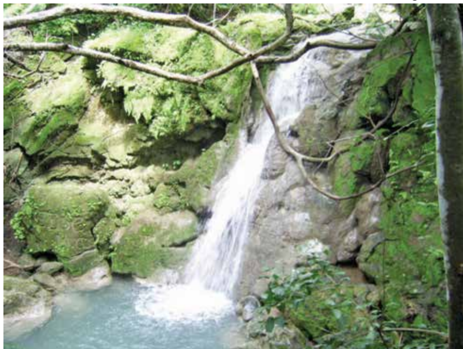
Foto 3. Vista de la Catarata El Salto, Cerro La Palma de Copal

Ubicada en el Cerro la Palma, es una caída de agua considerada por los pobladores como una piscina natural. Como recurso potencial, las actividades que se pueden realizar incluyen la observación de flora y fauna, camping y disfrute de la catarata y el río. Tiene una vocación turística media, al presentar una incidencia media en todos los indicadores que se utilizaron en la valoración.