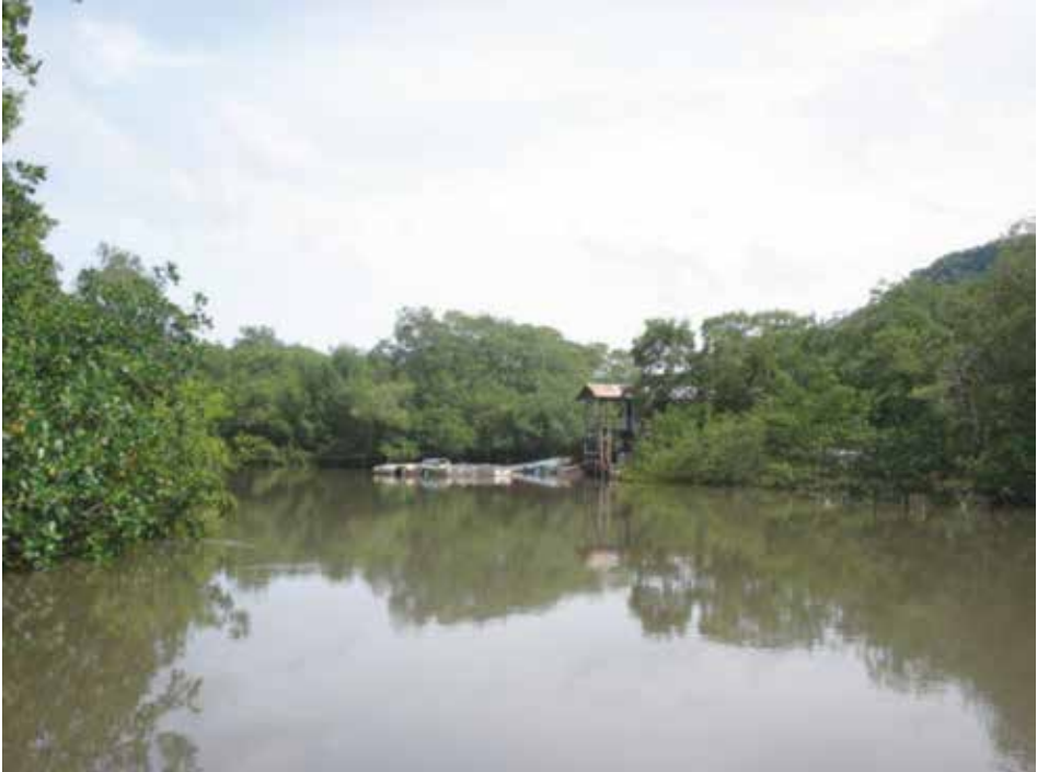
Foto 2. Manglar y estero Letras

requiere de un mínimo esfuerzo físico, su acceso se realiza por el embarcadero de Puerto Pochote, pero actualmente no existen las facilidades requeridas y reglamentadas para brindar el servicio de tours dirigidos.