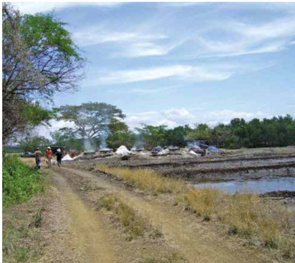
Foto 11. Sendero hacia las salineras de Copal