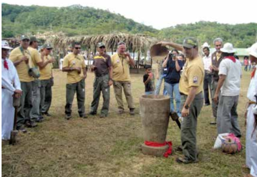
Foto 13. Visitantes internacionales en las fiestas tradicionales

fiestas patronales se realizan en el centro de la comunidad, por lo que el esfuerzo físico para su disfrute es mínimo; la misma ventaja se presenta con el acceso, debido a que éste tampoco implica un esfuerzo físico por parte de los turistas. Además, las fiestas patronales no presentan ningún riesgo para los visitantes; se cuenta con instalaciones en buen estado y se toman las precauciones debidas para evitar accidentes.