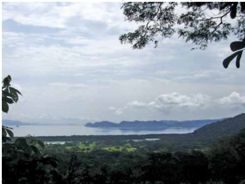
Foto 1. Vista del Golfo de Nicoya desde Cerro la Tigra de Copal