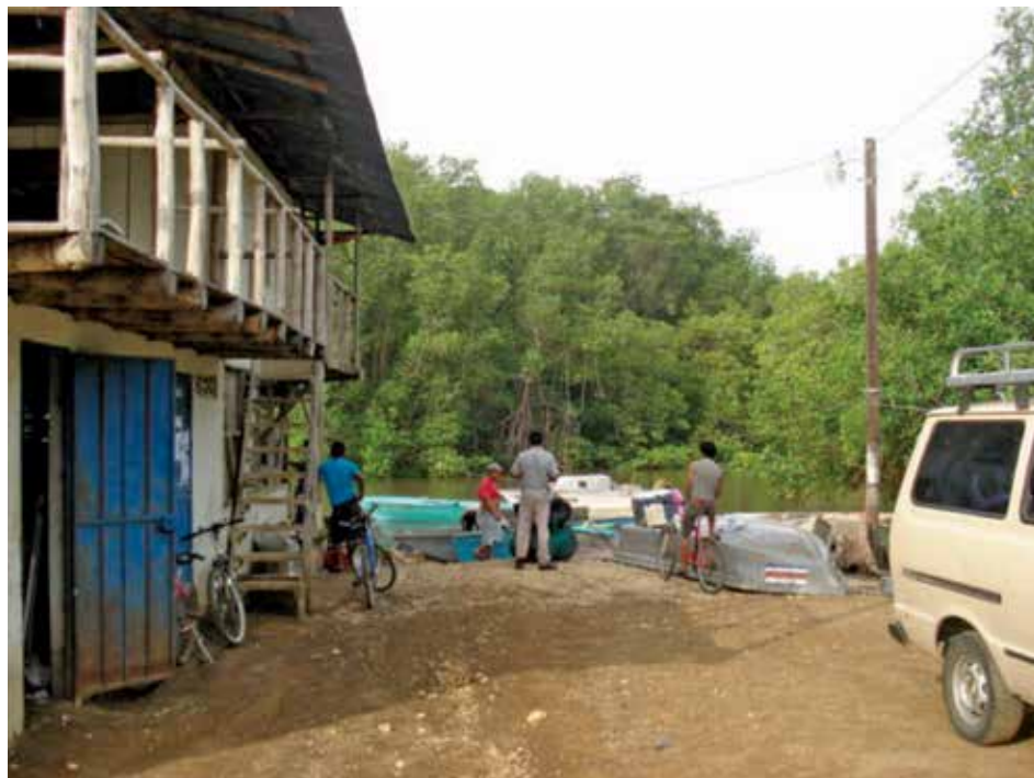
Foto 7. Embarcadero Puerto Pochote, a orillas del Estero Letras