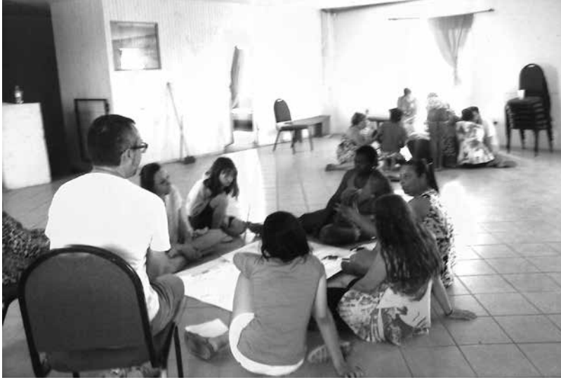
Figura 7: Los cuerpos en el taller de Cartografía Social instituyen un diálogo que compone la obra cartográfica a partir de la experiencia de una producción colectiva.