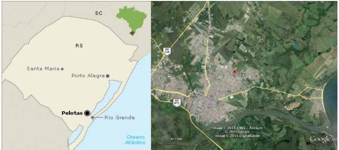
Figura 1. Mapa de localización de Pelotas en el estado de Rio Grande do Sul e Brasil/ Image Google Maps ©: localización del barrio Dunas de Pelotas en el contexto de su mancha urbana.

Fuente: Google Maps ©, 2015. Edición: de los autores.