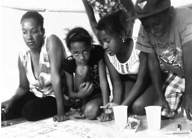
Figura 11 y 12. Los niños y los mapas producidos. Cartel utilizado para la difusión del taller.