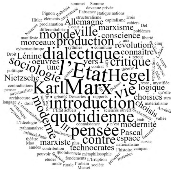
Figura 2. Principales palabras en las publicaciones de Henri Lefebvre, 1934-2018 se incluyó en el apartado “Los espacios de representación una dimensión espacial de la teoría unitaria de la producción del espacio”

Fuente: Elaboración propia mediante una plataforma de nubes de palabras