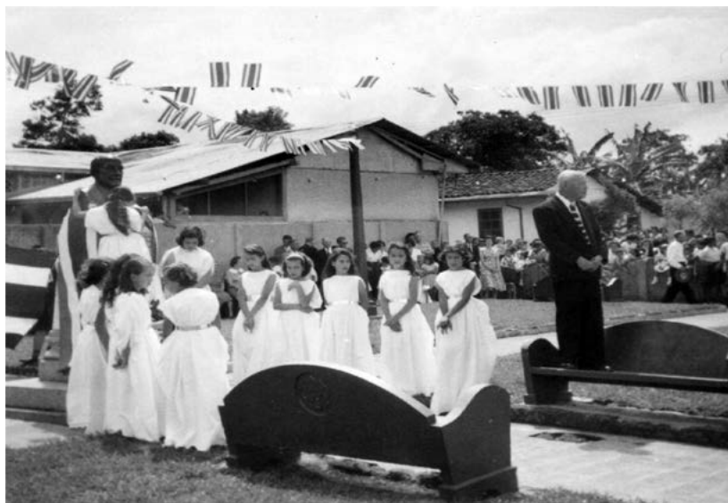
Acto cívico en la década de 1950 en el Parque Cleto González Víquez