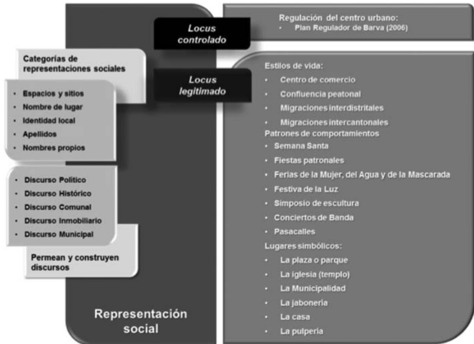
Figura 6 Categorías, discursos y representaciones sociales en Barva