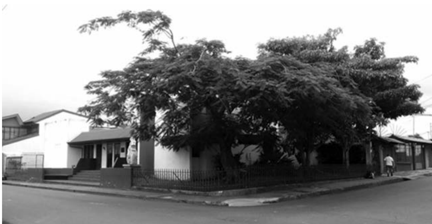
Casa de la Cultura de Barva (2015), antiguo Parque Cleto González Víquez