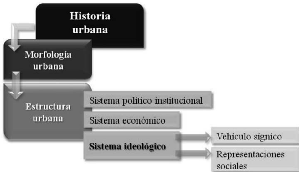
Figura 1 Itinerario teórico

Antes de iniciar con el procesamiento y el análisis de las aportaciones de los informantes, es necesario exponer los conceptos empleados para interpretar las significaciones del corpus documental formado. Para ello se recurrió a la elaboración de un itinerario teórico que los incluye y concatena –figura 1–.