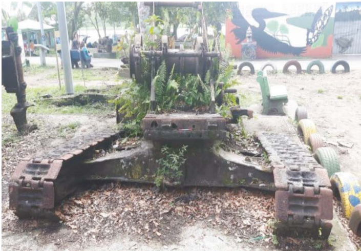
Figura 5. Restos de maquinaria Caterpillar

Entre la maquinaria más sobresaliente —por su tamaño— se encuentra un tractor de oruga de marca Caterpillar —ver figura 5—, el cual pudo facilitar el levantamiento, acomodo y transporte de troncos, tanto en el lugar de extracción como a su llegada al aserradero de Tortuguero. La empresa Caterpillar Inc. surgió en 1925, tras la fusión de la Holt Manufacturing Co. y C. L. Best Gas Tractor Co. , con sede en Illinois, Estados Unidos. 44