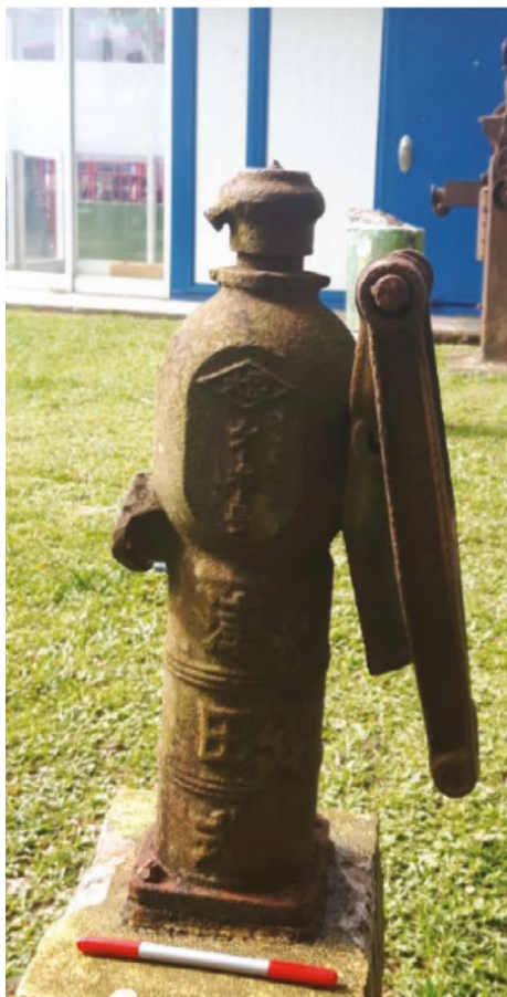
Figura 4. Bomba de mano para extracción de agua, marca Tsuda —origen japonés—, hallada en el sitio arqueológico industrial Tortuguero