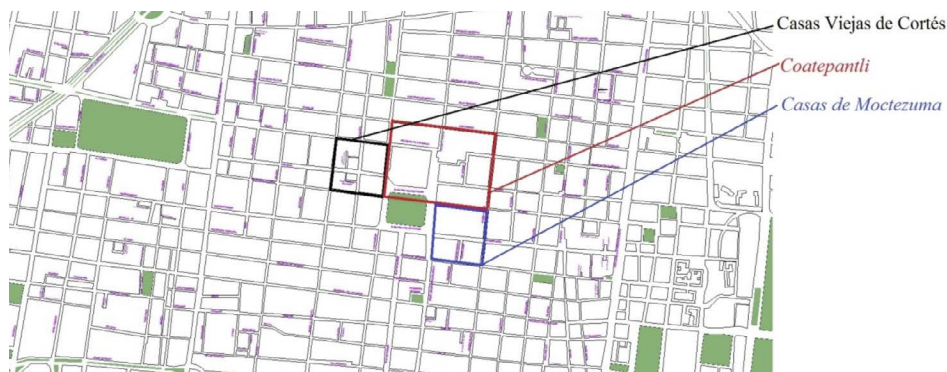
Figura 1. Casas viejas de Cortés, las casas de Moctezuma y Coatepantli 35 en la actualidad