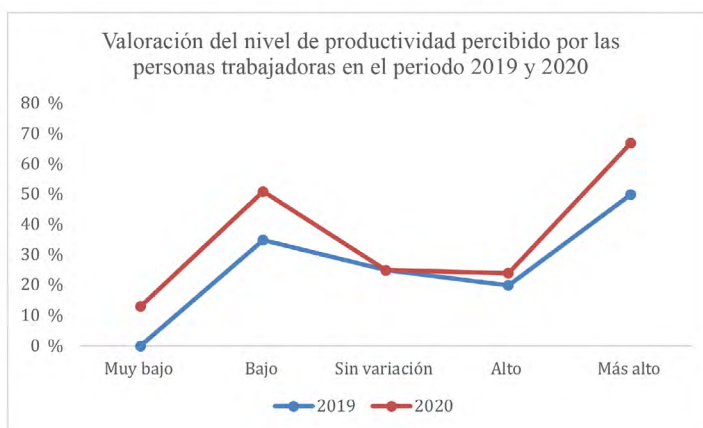
Figura 2: Valoración de productividad por parte de la persona trabajadora

Las personas participantes en el estudio, coinciden, en ambos periodos, en que su nivel de productividad es mayor en la modalidad de trabajo a distancia, esto se puede comparar con los resultados de las desventajas del teletrabajo que indican que existe una tendencia a trabajar más horas de la jornada establecida, lo que en consecuencia puede inducir este aumento en la productividad. No obstante, esto también tiene consecuencias en la calidad de vida de las personas puesto que se afectan otras áreas de bienestar, como el tiempo social y emocional.