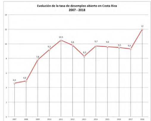
Figura 3: Evolución de la tasa de desempleo abierto en Costa Rica 2007-2018. Fuente: elaboración propia con base en INEC (2019).