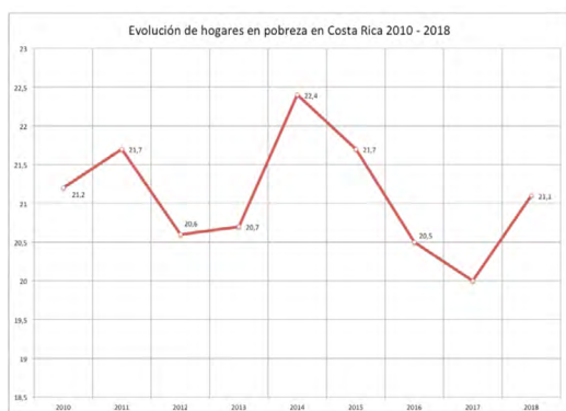
Figura 4: Evolución de hogares en pobreza en Costa Rica 2010-2018. Fuente: elaboración propia con base en INEC (2018).

Hasta el año 2008, la tendencia de la tasa de desempleo abierto 16 se había mantenido en cifras regulares que se pueden entender como un conjunto de datos que evidencian cierta estabilidad en la oferta y demanda de empleo en el país. Esta primera etapa termina exactamente una década atrás y, a partir de entonces, se inaugura con un cambio abrupto (4.9 a un 7.8) el lapso que es de interés en este estudio.