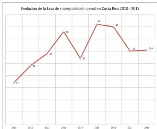
Figura 6: Evolución de la tasa de sobrepoblación penal en Costa Rica 2010-2018.

Fuente: elaboración propia con base en ONU (2018), MJP (2018) y Estado de la Nación (2018).