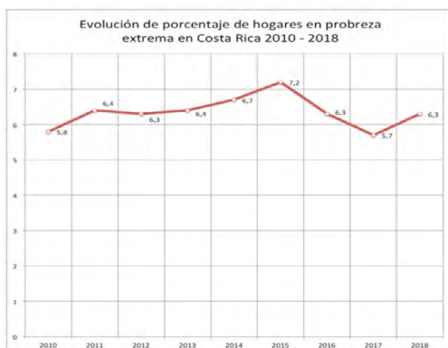
Figura 5: Evolución del porcentaje en pobreza extrema en Costa Rica 2010-2018. Fuente: elaboración propia con base en INEC (2018).

Luego de la primera alza del desempleo, este se mantiene fluctuando en números que, a pesar de ser preocupantes, no representan cambios de la misma magnitud hasta el 2018, cuando se produce un incremento dramático comparable al de la década pasada, lo que nos hace asumir como hipótesis que estamos frente a una posible nueva etapa de alarmante crisis del empleo en Costa Rica.