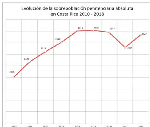
Figura 7: Evolución de la tasa de sobrepoblación penitenciaria absoluta en Costa Rica 2010-2018.

Fuente: elaboración propia con base en ONU (2018), MJP (2018) y Estado de la Nación (2018).