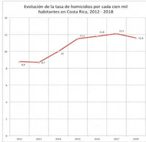
Figura 1: Evolución de la tasa de homicidios 2012-2018. Fuente: elaboración propia con base en INEC (2018).