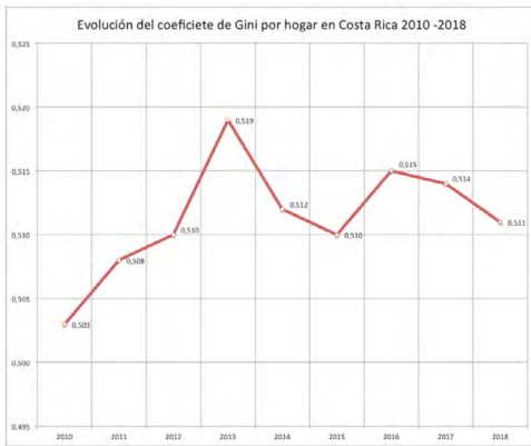
Figura 2: Evolución del coeficiente de Gini por hogar en Costa Rica 2010-2018. Fuente: elaboración propia con base en INEC (2019).