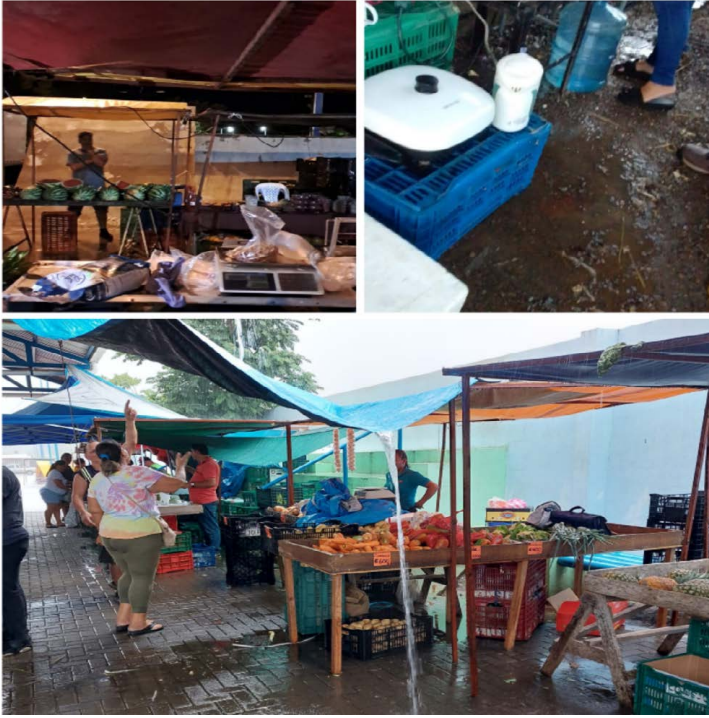
Figura 3 Instalaciones del Polideportivo Moraga, donde se realiza la Feria de Agricultores de Barranca