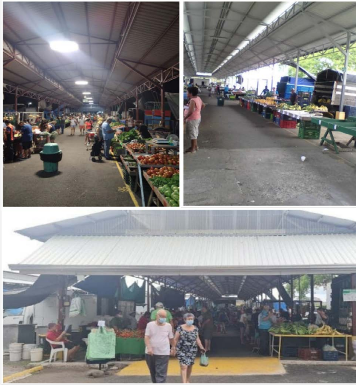
Figura 2 Instalaciones del CNP donde se realizaba la Feria de Agricultores de Barranca