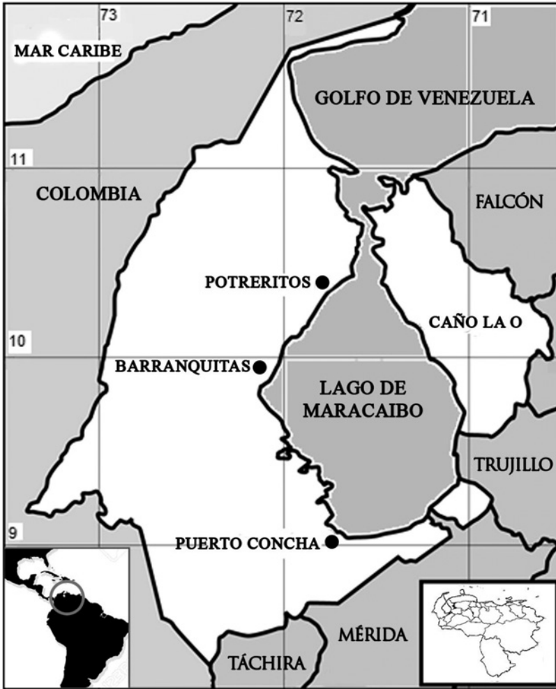
Fig. 1. Ubicación relativa nacional y regional del lago de Maracaibo. Se resaltan los puertos pesqueros más importantes. El área en blanco se corresponde con el estado Zulia