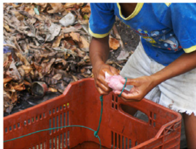
Fig. 2. Dibujo de un palangre típico (arriba). Cesta en la que se transporta y amarre de la carnada (abajo)