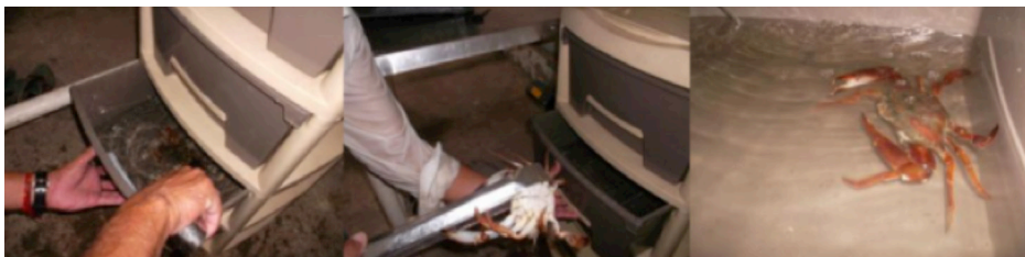
Fig. 2. Selección de jaibas para prueba preliminar

El experimento 1 consistió en alimentación con pescado fresco ( Mugil incilis ) y alimento concentrado para camarón (34% de proteína), con la variante de la adición de calcio mineral ( Ca^{+} ) al pescado fresco. El pescado fue fileteado y cortado en cubos de aproximadamente \frac{1}{2} \text{ cm}^3 . El calcio empleado para el experimento