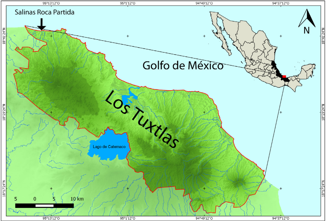
Fig. 2. Mapa de la región de los Tuxtlas, suroeste del golfo de México, la flecha indica el área de estudio de la comunidad pesquera de Salinas Punta Roca Partida, Veracruz, México