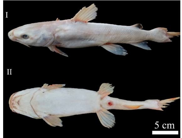
Fig. 2. Vista lateral (I) y ventral (II) de una hembra madura de Ariopsis felis con albinismo, capturada en el sureste del Golfo de México