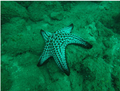
Fig. 1. Individuo de P. cumingi fotografiado en el 2017.

La Pecerita) del arrecife rocoso de Los Cóbano, que se ubica dentro del Área Natural Protegida (ANP) Complejo Los Cóbano (Fig. 2) a 11 km al Oriente del municipio de Acajutla, Sonsonate, en la zona comprendida entre Punta Remedios y Barra Salada (ICMARES, 2006). Se establecieron dos transectos paralelos a la costa, en bandas de 30 m de longitud por 2 m de ancho, con una separación de 5 m entre sí, contabilizando y midiendo el radio mayor (R) y radio menor (r) de los organismos encontrados. Se cubrió un área de 120 m 2 por cada punto de muestreo y una superficie total de 720 m 2 .