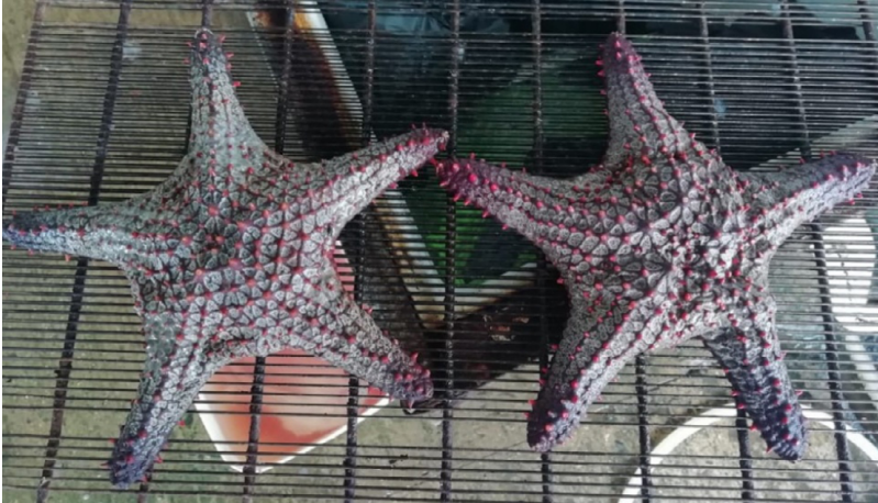
Fig. 3. Ejemplares de Pentaceraster cumingi capturados con trasmallo de fondo (2020) y comercializados en el puerto artesanal de Acajutla, El Salvador.