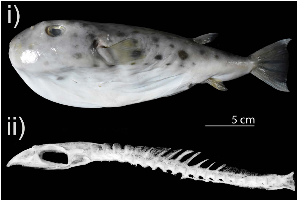
Fig. 2. Sphoeroides pachygaster . i) Ejemplar del capturado en suroeste del golfo de México (CIFI-1 729; 278 mm de longitud total (LT)); ii) esqueleto axial de un organismo de 370 mm de LT

Blunthead puffer (English) / Conejo de hondura, pez globo de hondura (español) (Fig. 2, Cuadro 1)