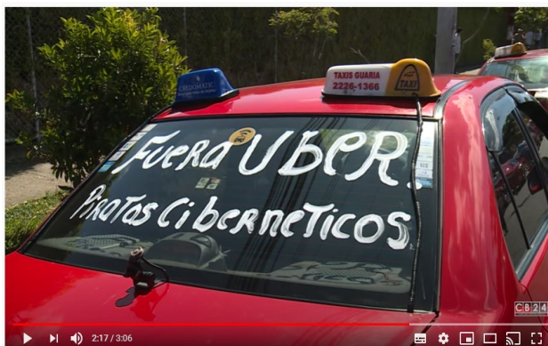
Mujer taxista se encadena frente a casa del presidente de Costa Rica en protesta contra Uber

Nota: Virginia Moreira (10 de febrero de 2016). Mujer taxista se encadena frente a casa del presidente de Costa Rica en protesta contra Uber. Noticiero CB24.