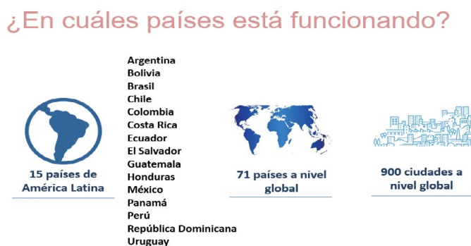
Figura 1. Países de América Latina, países y ciudades a nivel global en los que funciona la aplicación de Uber

Nota: https://www.uber.com/global/es/cities/