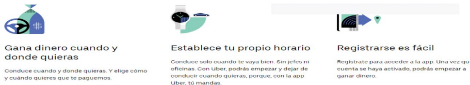
Figura 4. Conducir con Uber, gana dinero con tu propio horario

Nota: Página Web Uber Costa Rica (2020). https://www.uber.com/a/join-new .