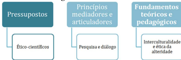
Figura 03: Fundamentos episte(m) todológicos do ER

Fonte: Riske-Koch e Oliveira (2020) a partir da BNCC (Brasil 2017).