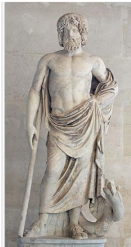
Figura 1. Dios Asclepio