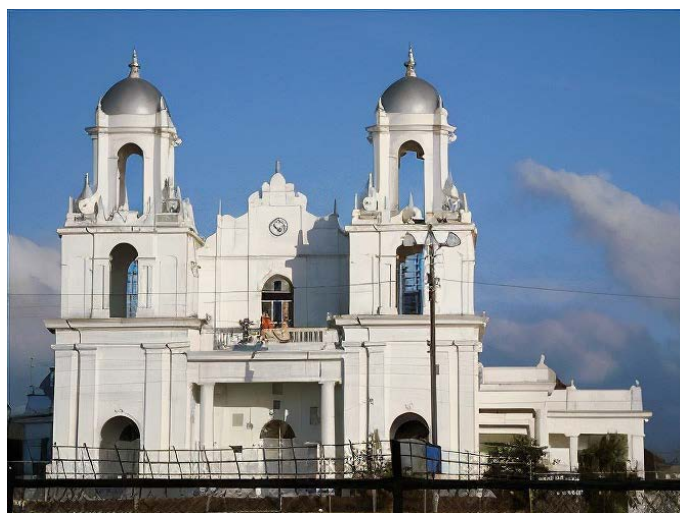
Figura 6. Basílica de Santo Domingo de Heredia