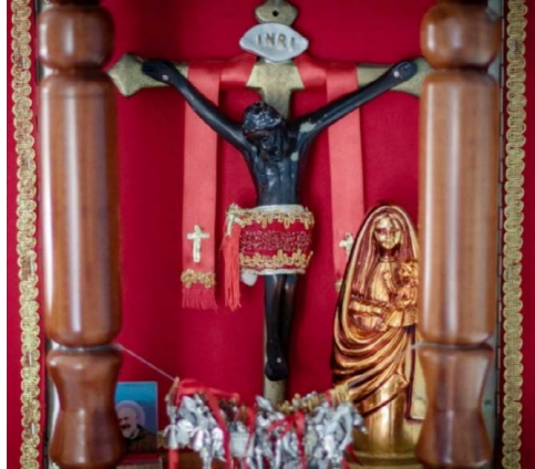
Figura 3. Cristo Negro de Esquipulas, Santa Cruz de Guanacaste