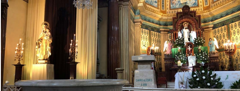
Figura 7. Imagen de Santo Domingo de Heredia