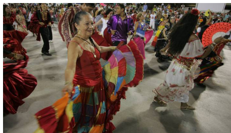
Figura 2. “Músicos e Cartomantes, desfile da escola de samba Unidos da Viradouro, Rio de Janeiro

Na figura 2 se observa a ala “Músicos e Cartomantes” do desfile da escola de samba Unidos da Viradouro, Rio de Janeiro, 1992.