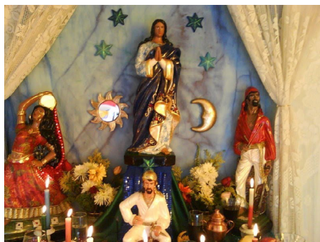
Figura 3. Santa Sara Kali e aos espíritos ciganos.