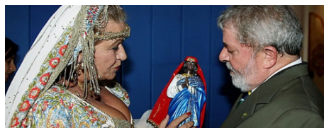
Figura 6. Mirin Stanescon com Luiz Inácio Lula da Silva

Na figura 6 podemos observar Mirin Stanescon apresentando o então presidente Lula com uma imagem de Santa Sara.