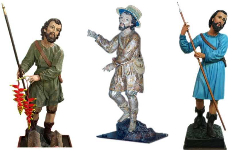
Figura 3. Esculturas policromadas de San Isidro; a la izquierda, la imagen de Sabanilla de Alajuela; al centro, la que se conserva en el Museo de San José de Orosi; a la derecha, la escultura tallada por Lico Rodríguez, que se conserva en la iglesia de San Isidro de San Ramón.