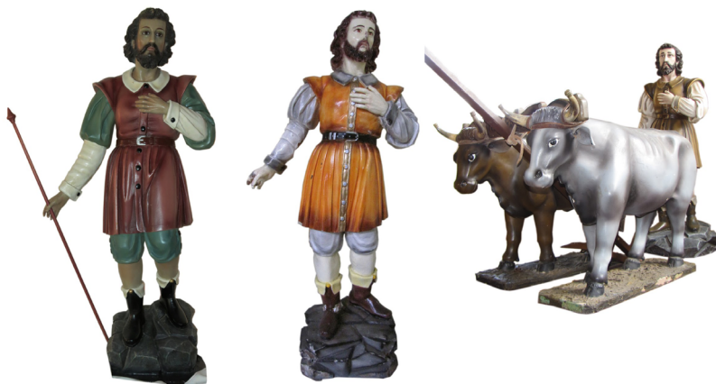
Figura 15. Comparativa de las imágenes pertenecientes a las parroquias de San Isidro de Barbacoas de Puriscal, San Juan Norte y San Gabriel de Aserrí