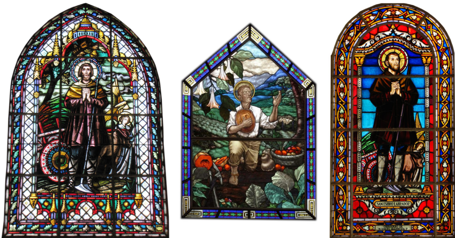
Figura 10. Vitrales con el santo labrador como tema central. De izquierda a derecha: vidriera en la iglesia de San Isidro de Heredia, vitral de San Isidro del Guarco, Cartago, y vidriera de la iglesia de San Francisco de Tabarcia, Mora.

son muestra de la dotación de obras de arte para este templo parroquial. Ello está asociado a la capacidad de generar recursos económicos a beneficio de la Iglesia por parte de esta población, conformada en sus inicios por personas agricultoras procedentes de San Rafael, San Pablo y Santo Domingo de Heredia, quienes hicieron denuncios de tierra a mediados del siglo XIX y generaron una actividad económica basada en el cultivo de la tierra y la lechería (Zamora, Álvarez y Vives, 2002).