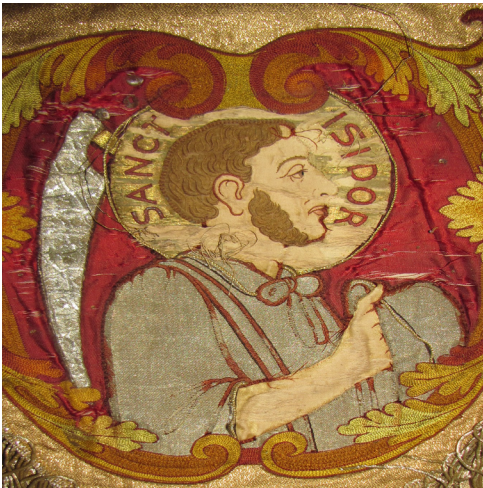
Figura 1. Detalle de la imagen textil de San Isidro Labrador en el palio empleado en las procesiones eucarísticas de la parroquia de San Isidro de Coronado