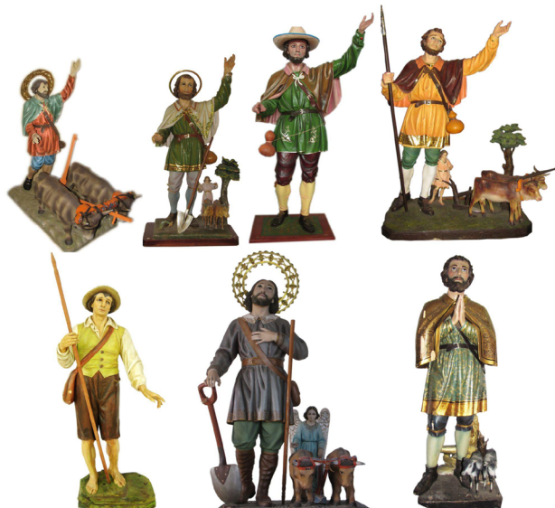
Figura 16. Comparativa de las imágenes encargadas a los talleres de Ferdinand Stuflesser para las iglesias de Tabarcia de Mora, Guayabo de Mora, Paraíso de Cartago, Barva de Heredia, Tres Ríos de Cartago, San Rafael de Puriscal y San Isidro de Heredia