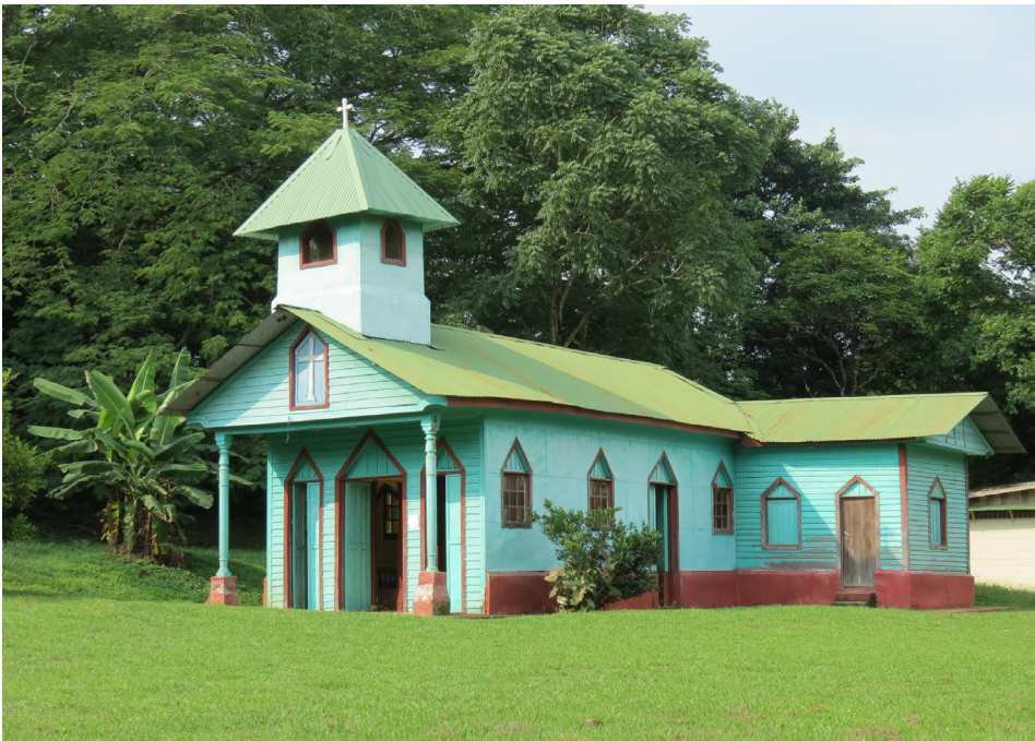
Figura 9. Iglesia de Balsilla de Mora, construida con la mano de obra gratuita de quienes poblaron el lugar entre 1918 y 1919

La edificación está incorporada al paisaje rural de un pueblo del valle central, por lo que viene a ser testimonio de los asentamientos de personas agricultoras que se comenzaron a crear en distintas