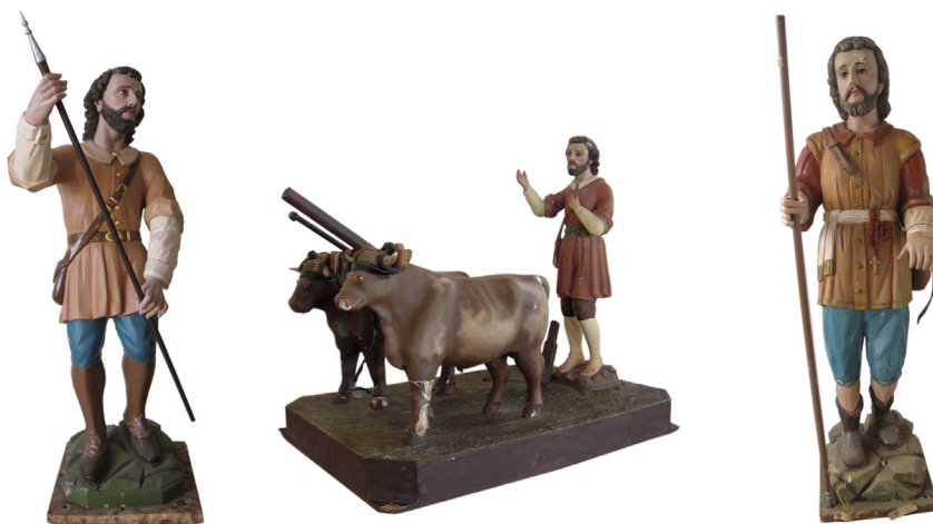
Figura 11. Comparativa de las imágenes pertenecientes a las parroquias de San Ignacio de Acosta, Salitrillos de Aserri y Sabanillas de Acosta