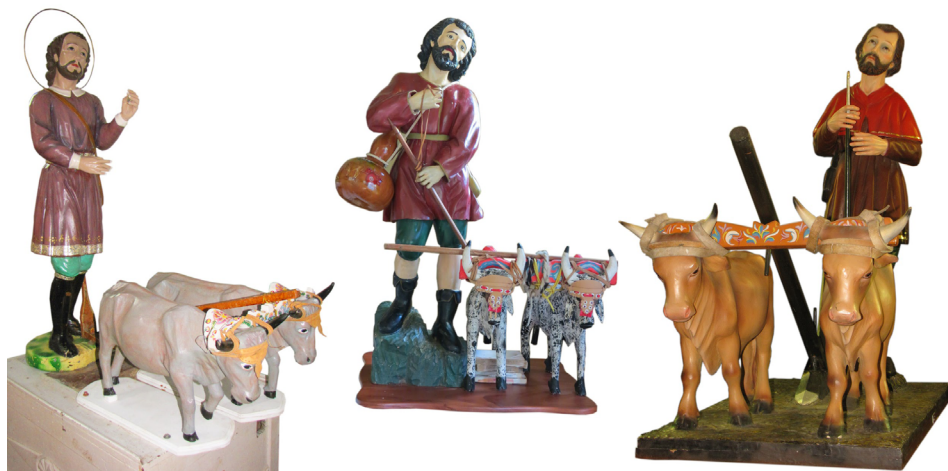
Figura 14. Comparativa de las imágenes pertenecientes a las iglesias de Jaris de Mora, San Isidro de Balsilla y Piedades de Santa Ana