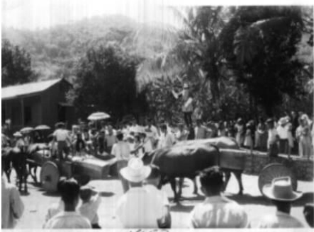
Figura 13. Presencia de la escultura de San Isidro atribuida a Serapio y Miguel Ramos, en la procesión patronal de Colonia Carmona, Nandayure en 1953, y en la sala de arte sacro que otrora existió en el Museo Nacional, en el antiguo Cuartel Bellavista (foto sin fecha).