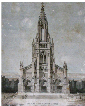
Figura 8. Diseños de las fachadas oeste y sur de la iglesia de Coronado firmados por el arquitecto y artista costarricense Teodorico Quirós Alvarado, conservados en la parroquia de Coronado

Entre los objetos destinados al uso litúrgico, se cuenta con un cáliz en el que figura Isidro en uno de los medallones esmaltados; el personaje es presentado en actitud devota, con el sombrero en mano, el azadón abrazado y vestido de trabajador. A esto se suma la presencia del santo en bienes textiles, como en el palio para las procesiones eucarísticas. Situación similar sucede con San Isidro de Heredia, que cuenta con un palio y una capa pluvial con imágenes del santo, lo cual da a entender que el culto al patrono no se reduce a sus fiestas en el mes de mayo, sino