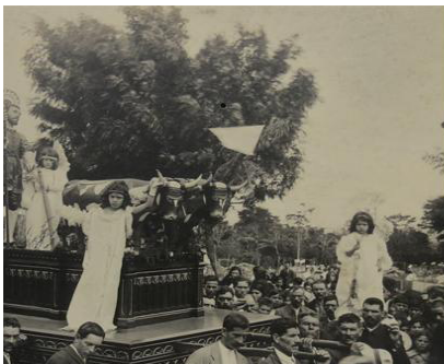
Figura 4. Comparativa de la procesión patronal en Coronado; a la izquierda, la imagen de San Isidro llevada en andas; a la derecha, fotografía de Manuel Gómez Miralles, del patrono procesionando en vehículo automotor (ambas fotografías sin fecha).

En el mundo existe un conjunto numeroso de bienes históricos, artísticos y literarios que dan cuenta del culto religioso a San Isidro Labrador. Al respecto, Puñal y Sánchez (2013) describen y analizan los documentos historiográficos en torno a la vida del santo, con énfasis en el códice medieval de Juan Gil de Zamora, así como los textos monográficos dedicados a exponer la vida del patrón de Madrid, luego de su canonización ocurrida en 1622, además de los escritos poéticos escritos en su honor, entre los que destaca “El Isidro”, de Lope de Vega, redactado entre 1596 y 1597.