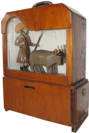
Figura 5. Camarín con escultura policromada de San Isidro limosnero, iglesia de El Alumbre, Corralillo, Cartago