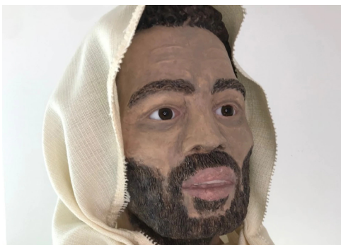
Figura 2. Reconstrucción facial de San Isidro Labrador a partir del informe forense del cuerpo venerado en la iglesia de La Colegiata en la capital española, a cargo de la Universidad Complutense de Madrid

y Francisco Javier, el 12 de marzo de 1622 (Labarga, 2020). Un ejemplo de la expansión del culto en Latinoamérica es la fundación de San Isidro, en Maunabo, Puerto Rico, en 1799 (Puñal y Sánchez, 2013).