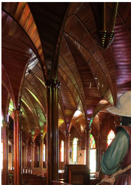
Figura 6. Vista posterior de la imagen patronal e interiores de la iglesia parroquial de Barbacoas de Puriscal. Nótese la colocación de atributos campesinos: calabazo, chonete y alforjas.

Entre sus elementos estéticos destacan, por su belleza y su fina laboriosidad, los arcos ojivales de madera de los interiores, los cuales posibilitan a quien ingresa a este espacio litúrgico, situarse de manera rápida en un lugar completamente distinto al exterior, lo que potencia la percepción de lo sagrado, lo separado de lo cotidiano y de lo común. También sobresale la presencia de imaginería de excelente calidad, tanto la de manufactura nacional como la que fue traída de Europa.