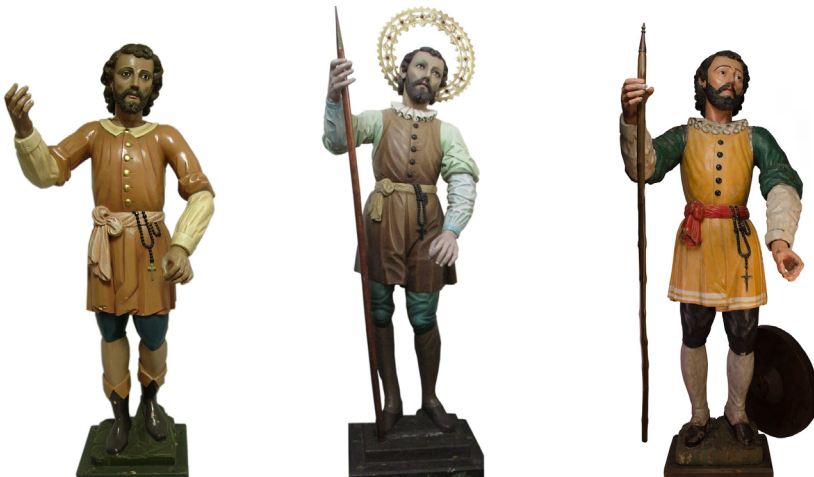
Figura 12. Comparativa de las imágenes pertenecientes a las parroquias de San Luis de Tolosa en Aserrí, a la de San Isidro de Coronado y a la colección del Museo Nacional de Costa Rica, atribuidas a los escultores cartagineses Serapio Ramos y su hijo Miguel Ramos Pacheco