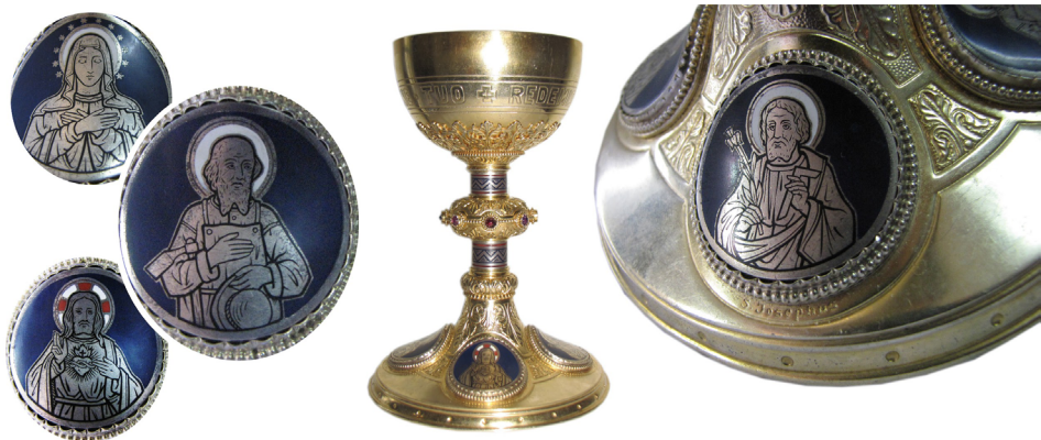
Figura 7. Vista general y detalles de los medallones decorativos de un cáliz con la inscripción “F. Printz y M. Gladbach” de la iglesia parroquial de Coronado. Los motivos iconográficos evidencian 4 importantes devociones en dicha comunidad: el Corazón de Jesús, la Inmaculada Concepción, San José y San Isidro Labrador.

Fuente: Inventario de arte sacro y objetos destinados al culto, Arquidiócesis de San José, 2007-2014.