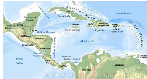
Ilustración 1: Mapa del mundo Caribe

Tomemos como modelo de lo dicho el siguiente mapa 4 :