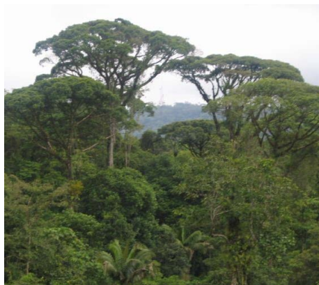
Ilustración 3 Parque Nacional Braulio Carrillo Gob. de CR

el PNBC cuenta con tres características muy importantes. Su tamaño, su rango altitudinal y su topografía. Con su tamaño se protege gran cantidad de especies biológicas y muchas de ellas cuentan con un área adecuada para mantener poblaciones viables a largo plazo, como por ejemplo la pájaro sombrilla ( Cephalopterus glabricollis ) e incluso la lapa verde ( Ara ambigua )". (Tenorio, 2007).