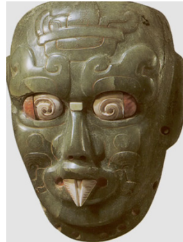
Figura 10 Dios Kinich Ahau

Nota. Imagen extraída de Pueblos originarios. Dioses y personales míticos Kinich Ahau. (Portal Cultural Azteca, s. f.).