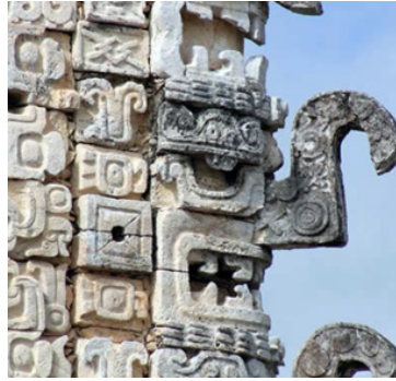
Figura 9 Dios Chaac

Nota. Imagen extraída de Pueblos originarios. Dioses y personales míticos. Chaac. Dios de la lluvia (Portal Cultural Azteca s. f., p.1).