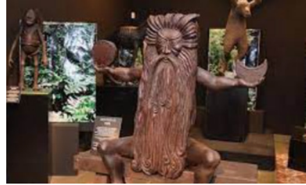
Figura 18 Dios Tupá