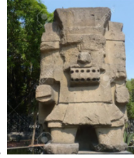
Figura 5 Imágenes de Tlaloc (Dios de la lluvia)