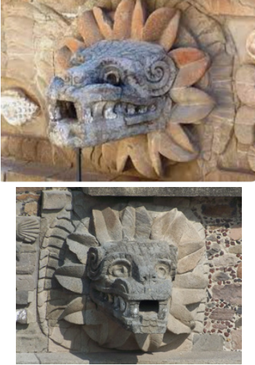
Figura 4 Quetzalcóatl la serpiente emplumada

Nota: Imágenes extraídas de Adéntrate en el mito de Quetzalcóatl, la “Serpiente Emplumada” (Ochoa, 2020, p. 1).