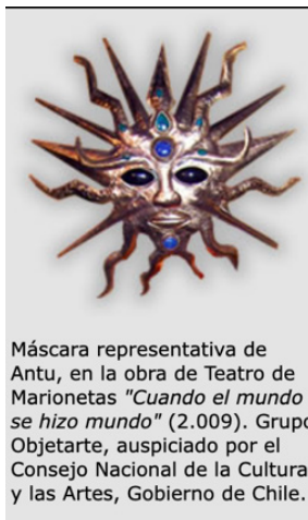
Figura 20 Dios creador

Máscara representativa de Antu, en la obra de Teatro de Marionetas "Cuando el mundo se hizo mundo" (2.009). Grupo Objetarte, auspiciado por el Consejo Nacional de la Cultura y las Artes, Gobierno de Chile.