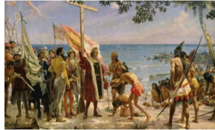
Figura 21 Comunidad indígena en América Latina

Nota: Imagen extraída de La Conquista provocó la muerte de casi el 90 % de los indígenas, consideran historiadores (Infobae, 2019, junio 1).