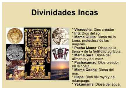
Figura 15 Divinidades incas

Nota. Imagen extraída de Dioses incas: nombres y significado (Romero Real, 2019, p. 1).