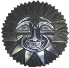
Figura 17 Representación del sol por los ticunas

Nota. Imagen extraída de Mitos y leyendas Colombianas. Dioses y leyendas Ticunas: región amazónica (Peña, 2014).