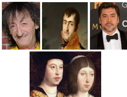
Figura 3 Modelo de cabezas

Esto es, durante los primeros cien años de la invasión, la población originaria del territorio mexicano “tuvo una reducción de hasta el 90 %” (Indígenas de México en la Agricultura de California, 2023, p. 2). No hay forma de pensar que se diezmaron de esa manera, porque se sacrificaron en honor al dios que llegó; excepto que haya un pensamiento vertical de que los pueblos originarios eran medio brutos y, por eso, ese tipo de cosas, podían pasar.