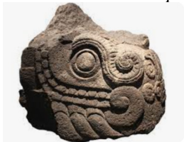
Figura 2 Cabeza del dios Huitzilopochtli