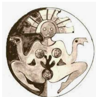
Figura 16 Pachamamna (madre tierra)

Nota. Imagen extraída de Pachamama: Madre Tierra (Caserita.com, 2012, p. 1).