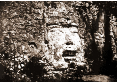
Figura 8 Dios Itzamná