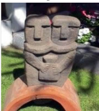
Figura 19 Dios Ngenechén

Escultura en piedra. Ngenechen es poseedor de dos pares de atributos opuestos: sexo masculino y femenino, juventud y ancianidad.