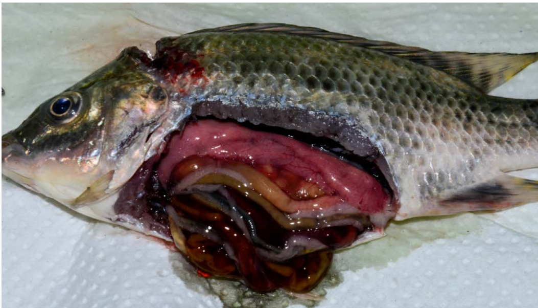
Figura 2. Principales patologías internas: Hígado friable y decolorado, vasculitis en hígado, congestión y hemorragia intestinal.