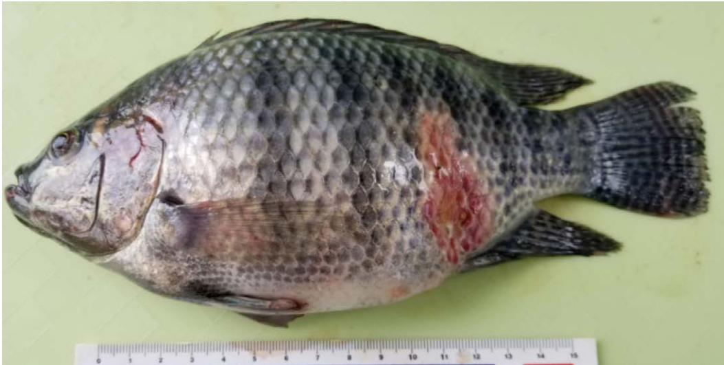
Figura 1. Principales patologías externas: Úlcera cutánea con áreas hiperémicas en diversas partes del cuerpo.

Shewanella presentan una estrecha relación con la signología de úlceras cutáneas, áreas hiperémicas, melanización corporal, hígado pálido y friable. Estos géneros corresponden al grupo catalogado como septicemia